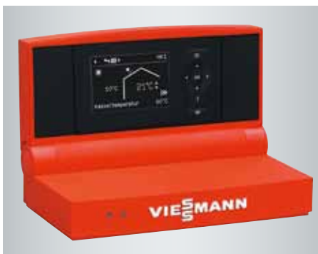
Vitotronic Regelung mit übersichtlicher Menüführung