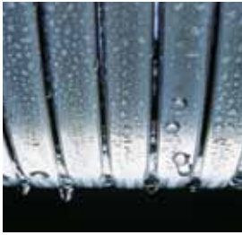
Inox-Radial-Wärmetauscher – langlebig und effizient