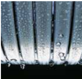
Inox-Radial-Wärmetauscher – langlebig und effizient