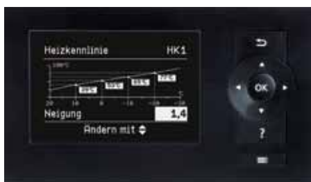
Vitotronic Regelung – einfache Bedienung durch menügeführte Benutzerführung und grafische Darstellungen, wie zum Beispiel der Heizkennlinienanzeige