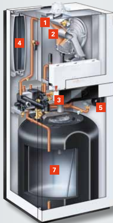
Vitodens 222-F (Typ B2TA) mit emailliertem Ladespeicher