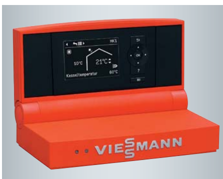
Vitotronic Regelung mit übersichtlicher Menüführung